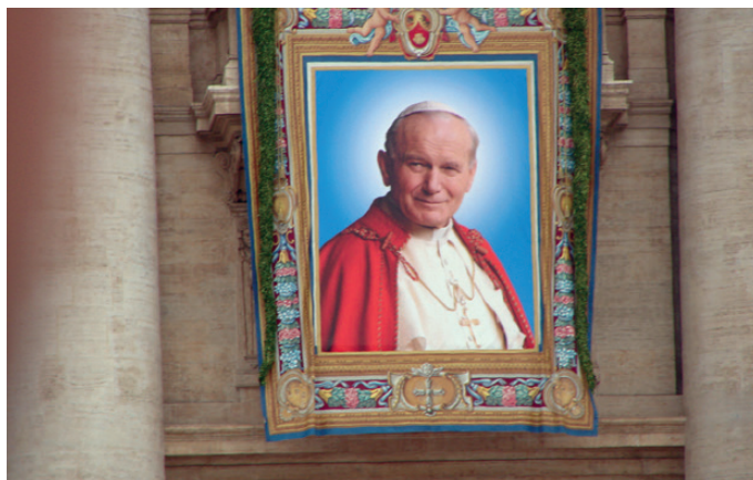
Rys. 3. Portret Ojca Świętego Jana Pawła II – podczas uroczystości beatyfikacyjnej w Rzymie.

• 1 maja 2011 r. na Placu Świętego Piotra w Rzymie odbyła się uroczystość beatyfikacji Ojca Świętego Jana Pawła II (por. [7]). W uroczystej Mszy Świętej, której przewodniczył Ojciec Święty Benedykt XVI, wzięło udział ponad milion ludzi, w tym około osiemdziesięciu tysięcy pielgrzymów z Polski. Na kolumnadzie Bazyliki Świętego Piotra został umieszczony portret Ojca Świętego Jana Pawła II (rys. 3). W swej homilii Ojciec Święty Benedykt XVI powiedział m.in.: ... Swoim świadectwem wiary, miłości i odwagi apostołskiej ten znakomity Syn narodu polskiego pomógł chrześcijanom na całym świecie, by nie lękali się być chrześcijanami, należeć do Kościoła, głosić Ewangelię. Jednym słowem: pomógł nam nie lękać się prawdy, gdyż prawda jest gwarancją wolności.