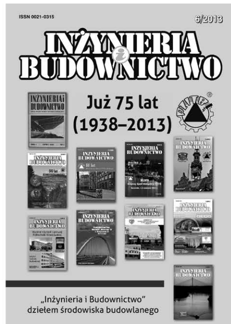
Przykłady okładek zeszytów „Inżynierii i Budownictwa”

wych i zawodowych, przemysłów i propozycji w dziedzinie budownictwa i inżynierii lądowej, w tym mostownictwa, a także możliwości prowadzenia dyskusji dotyczącej publikowanych prac oraz aktualnych problemów naukowych i technicznych środowiska budowlanego. Czasopismo od początku starało się i stara służyć projektantom konstruktorom, wykonawcom, inwestorom i użytkownikom, nadzorowi budowlanemu, rzeczoznawcom, pracownikom naukowym, a także studentom uczelni technicznych.