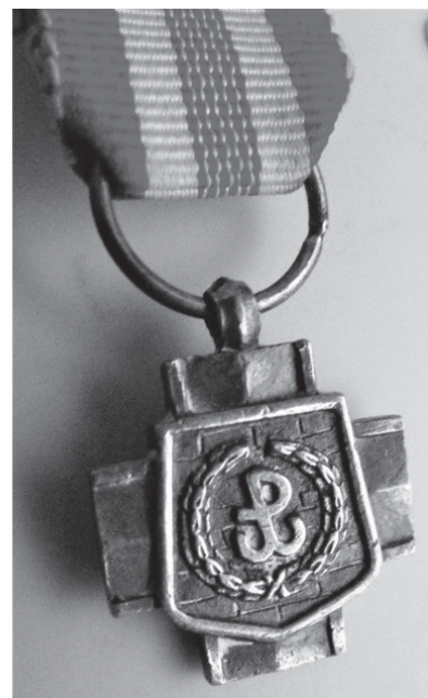
Rys. 2. Legitymacja i Krzyż Armii Krajowej (przekazany po wojnie)